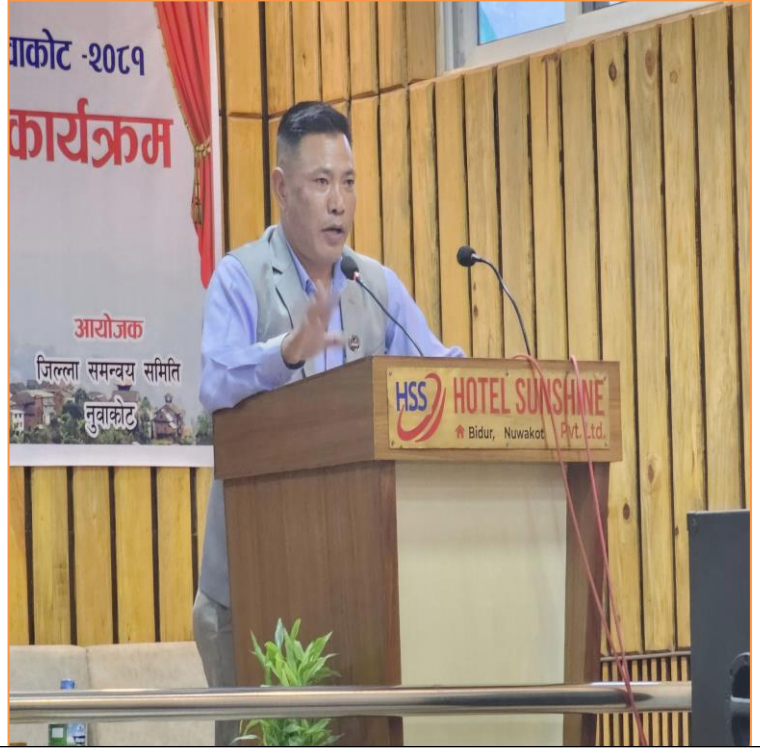
जिल्ला वस्तुगत विवरण, नुवाकोट २०८१ पुस्तक विमोचन कार्यक्रमका केही तस्वीरहरु