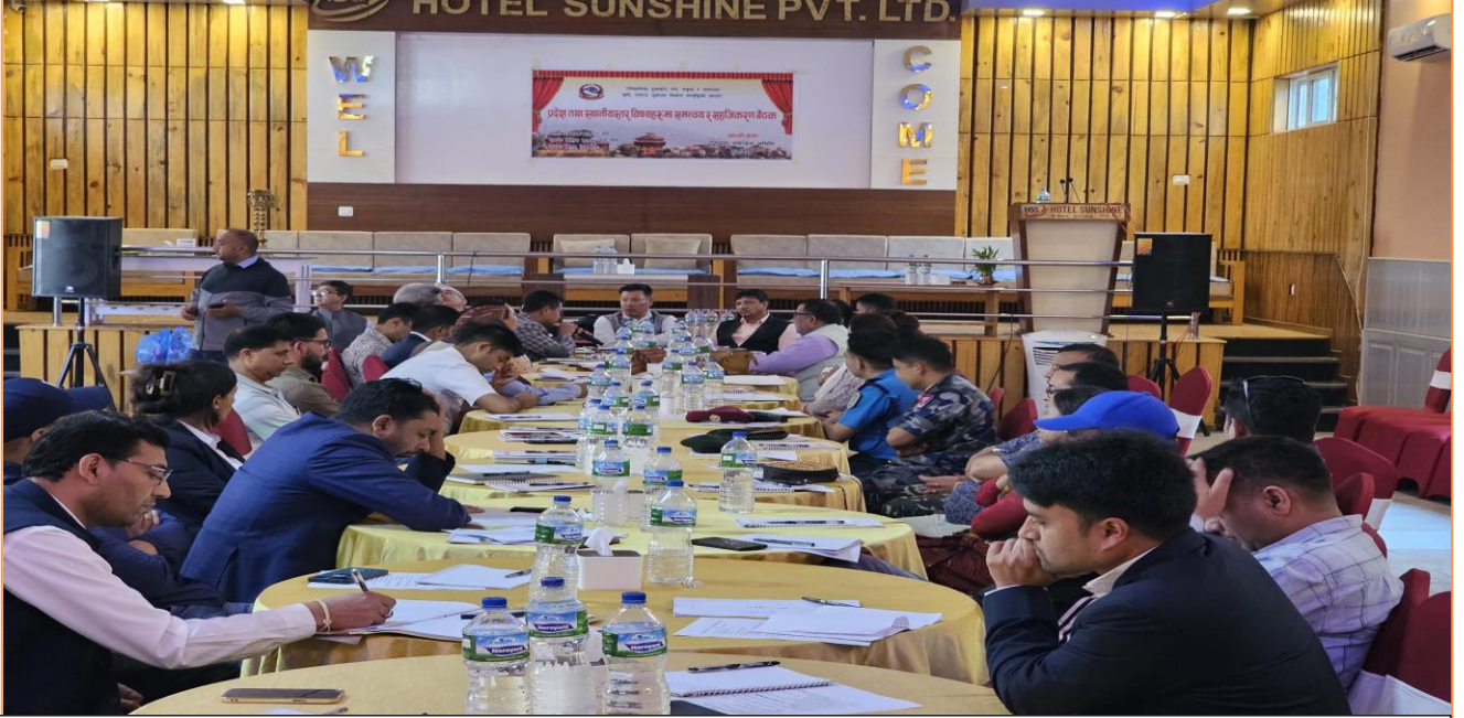
प्रदेश तथा स्थानिय स्तरका विषयहरुमा समन्वय र सहजिकरण बैठकका तस्विरहरु

कार्यक्रममा स्थानिय तहहरु, प्रदेश कार्यालयहरु तथा सरोकारवाला पक्षबिच वृहत छलफल पश्चात निर्णयहरु कार्यान्वयार्थ बागमती प्रदेश मुख्यमन्त्री तथा मन्त्रीपरिषद्को कार्यालय, आर्थिक मामिला तथा योजना मन्त्रालय, खानेपानी, उर्जा तथा सिंचाई मन्त्रालय, भौतिक पुर्वाधार विकास मन्त्रालय र प्रदेश नीति तथा योजना आयोगमा पठाइएको छ ।