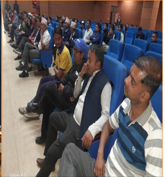
दोस्रो त्रैमासिक समिक्षा कार्यक्रमका केही तस्विरहरु