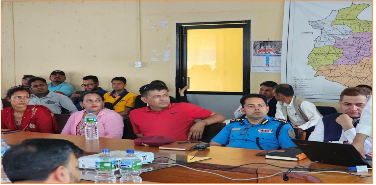
विपदको व्यवस्थापन तथा वातावरण संरक्षण सम्बन्धि कार्यक्रमको थप तस्विरहरू