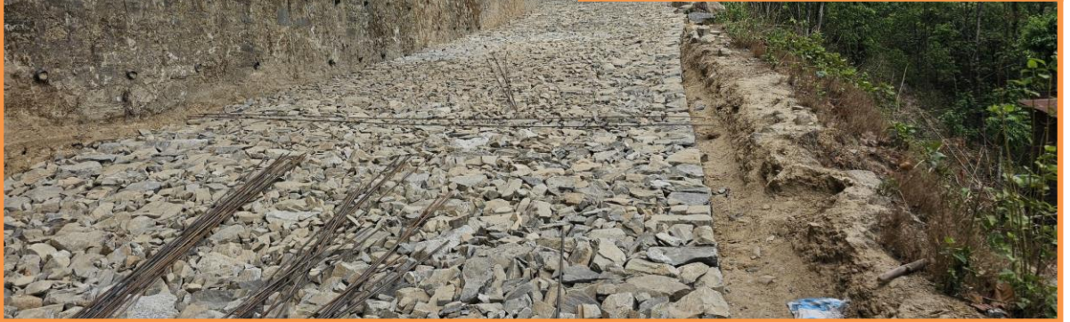
जिल्ला समन्वय समिति, नुवाकोट द्वारा योजना अनुगमनका क्रममा कैद गरीएका तस्विरहरू