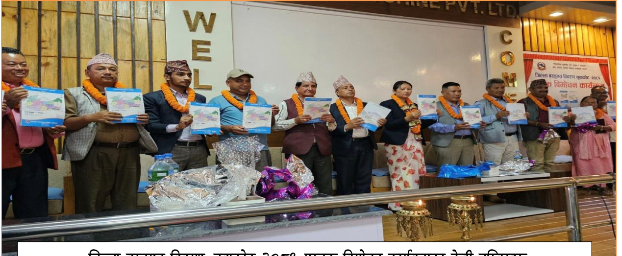
जिल्ला वस्तुगत विवरण, नुवाकोट २०८१ पुस्तक विमोचन कार्यक्रमका केही तस्वीरहरू